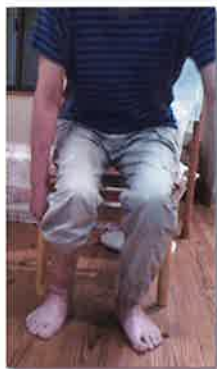
リハビリ後 右膝が内側に入らず立てるようになりました

ど、一つひとつ確認していきました。そして、十分に右手を確認した後、左手ではどう感じるのかを比較する練習を実施しました。結果、「ここを曲げたいですね」「そんなに力がいきりませんね」と訴えが変化し、親指と他の指を合わせる事が上手になりました。普段動かす時も、どのようになりかを感じることでも力が抜けるようになりました。このように、まひがある手だけでは感じにくい状態でも、まひのない手と比べることで感じ方に変化が起きることがあります。