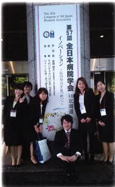
(写真は今年の9/11～13に北海道で開催された)

今年には当院から総勢33名が参加し、そのうち、13名が研究を発表しました。私たちは今後も学会を通し、知識と技術の向上に努め、より質の高い医療を提供していきたいと考えています。