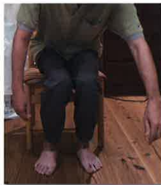
リハビリ前 立つ時に右膝が内側に入っています

とお尻にかかる体重に違いがあります。これらの練習を通し、「おじぎをして立つ瞬間には右足の裏に体重が乗っています。右足を使えていますね」と訴えが変化し、立ち上がりがスムーズになりました。腰のねじれやお尻の体重移動が上手にできていないことが「足の裏を感じる」ことを難しくしていたのです。